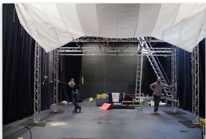
Structure autonome et parachute ignifugé. A titre d'échelle, les moutons présents sur la photo mesurent environ 1m70.